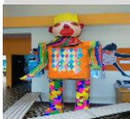
Mr ou Mme Carnaval Bibliothèque