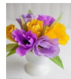
Bâton de pluie et fleurs