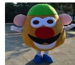
Créons carnaval junior !

85 rue du Lunaret CS24492 – 34093 Montpellier Cedex Programme sous réserve de modifications